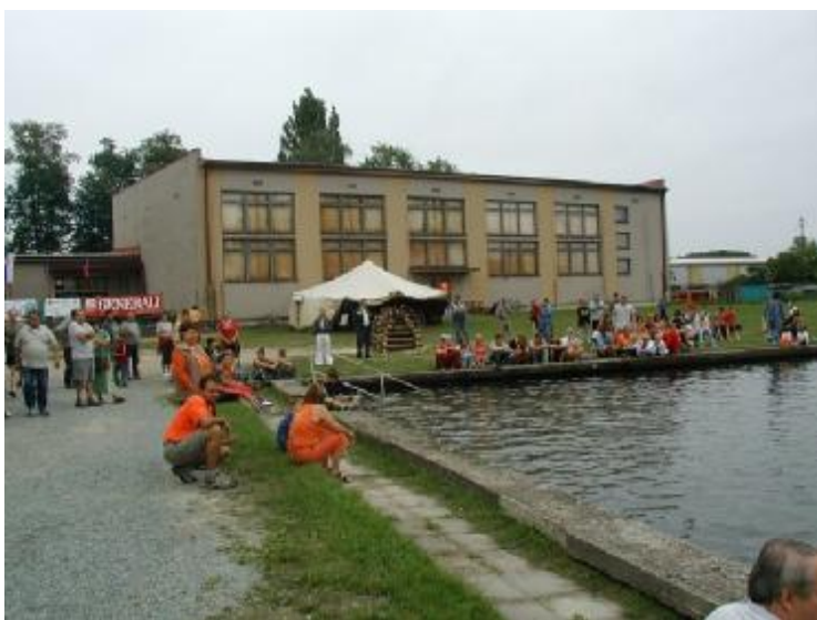
voriáda 2006 na solnickém koupališti