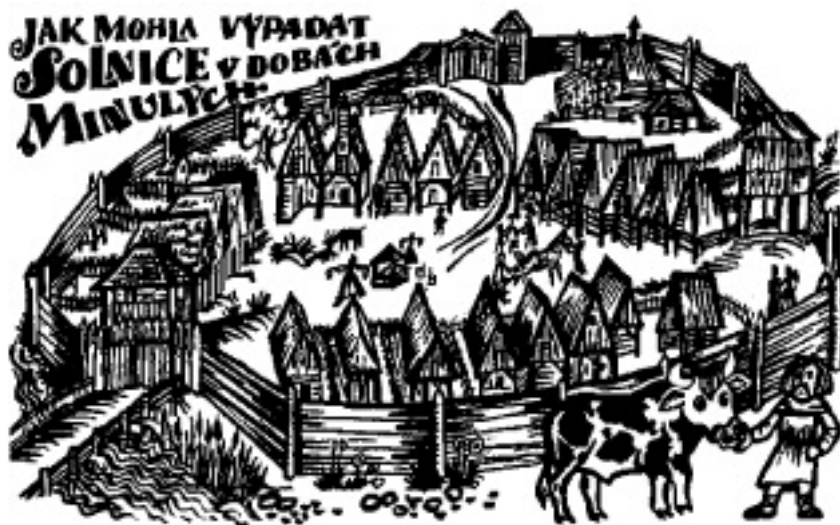
Ilustrace: Jarmila Haldová (Pověsti Orlických hor a Podorlicka)

Městečko Solnice patřivalo totiž od nepaměti k panství skuhrovskému a později porýnskému. Bývalo, jako téměř všechna města v Čechách, ohrazeno, mělo tři brány a okolní šlechta mívala v něm své domy.